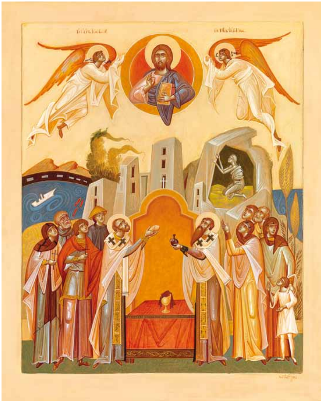
ΤΑ ΣΑ ΕΚ ΤΩΝ ΣΩΝ ΣΟΙ ΠΡΟΣΦΕΡΟΝΤΕΣ (Έργο Γ. Κόρδη)